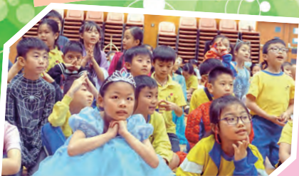
好緊張呀！哪一組會勝出呢？