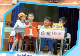
我識答！我識答！讓我講出正確的答案！