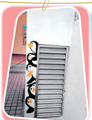
企鵝層層疊 創作者：5B 鄧詠綺