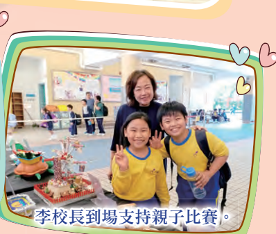
李校長到場支持親子比賽。