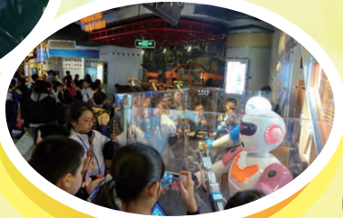
上海科技館有很多有關STEM元素的應用技能，真是大開眼界。

為擴闊視野，豐富多元經歷，本校已於2018年11月28日至30日為五年級全體同學舉辦上海歷史及科技探索之旅。行程中，我們親身體驗懸浮列車的速度，明白電磁力實現列車與軌道之間的無接觸的懸浮和導向的原理。另外，我們參觀了科普教育基地——上海科技館，了解中國的航天科技、機器人的發展和生活上的應用。