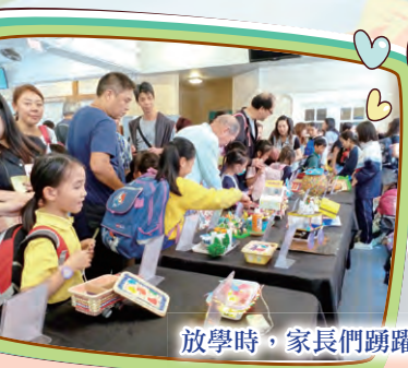
放學時，家長們踴躍投票，氣氛熱烈。