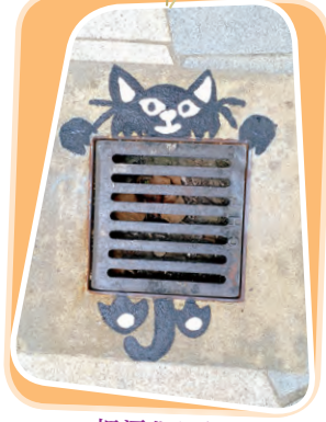
把渠化作貓 創作者：6D 吳子晴