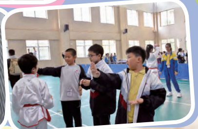
最令同學印象深刻的就是前往上海市靜安區閘北實驗小學，我們和上海的同學一同學習中國武術、乒乓球、彈琵琶、書法等。