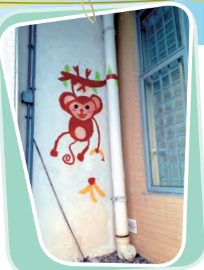
猴子偷看校務處 創作者：5D 陳咏廷