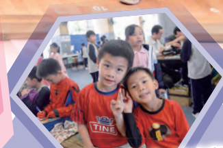
這是我們一年級第一次參與閱讀日，真是好開心啊！