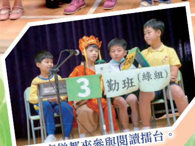
唐僧都來參與閱讀擂台。