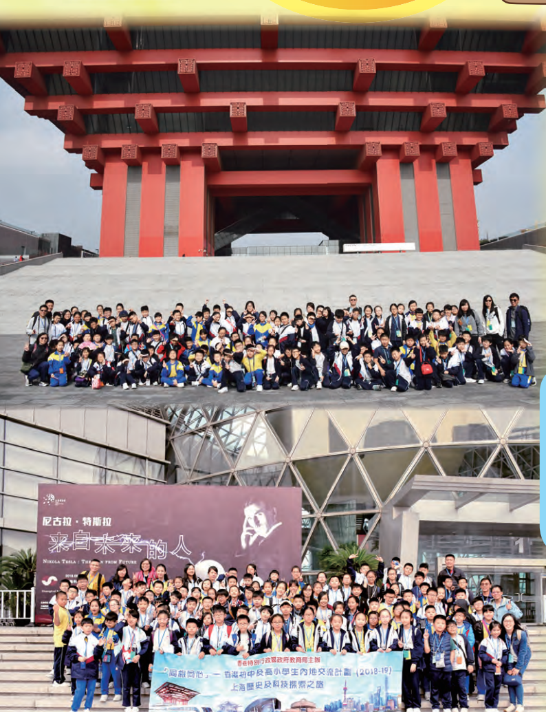
我們在上海科技館及中華藝術宮前大合照！

這三天我們還到過上海著名景點，東方明珠廣播電視塔、上海外灘、中華藝術宮、上海創意產業的發源地田子坊、上海博物館和上海城市規劃展示館。