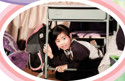
究竟發生甚 麼事呢？