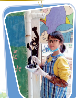
黑貓偷爬渠 創作者：5D 鄭凱兒