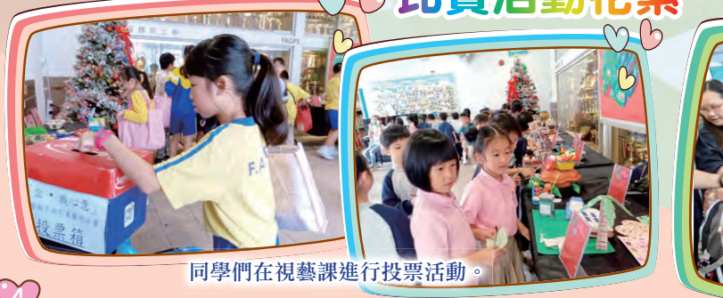
同學們在視藝課進行投票活動。