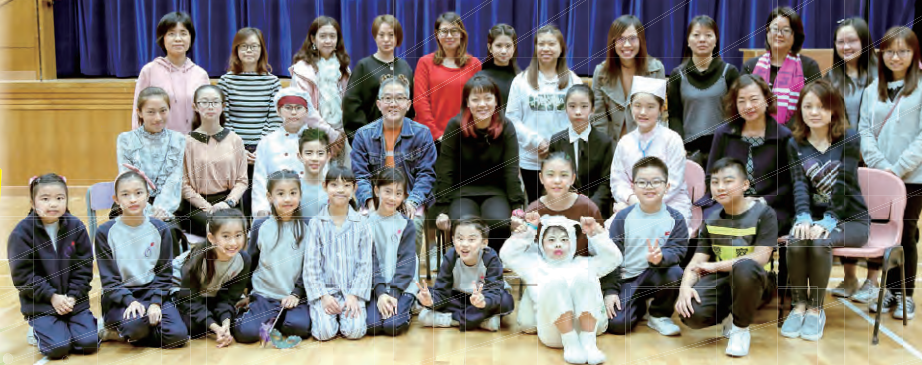
終於演出完成，大家來張大合照！