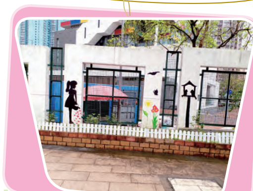
愛的灌溉 創作者：6C 梁雯晴