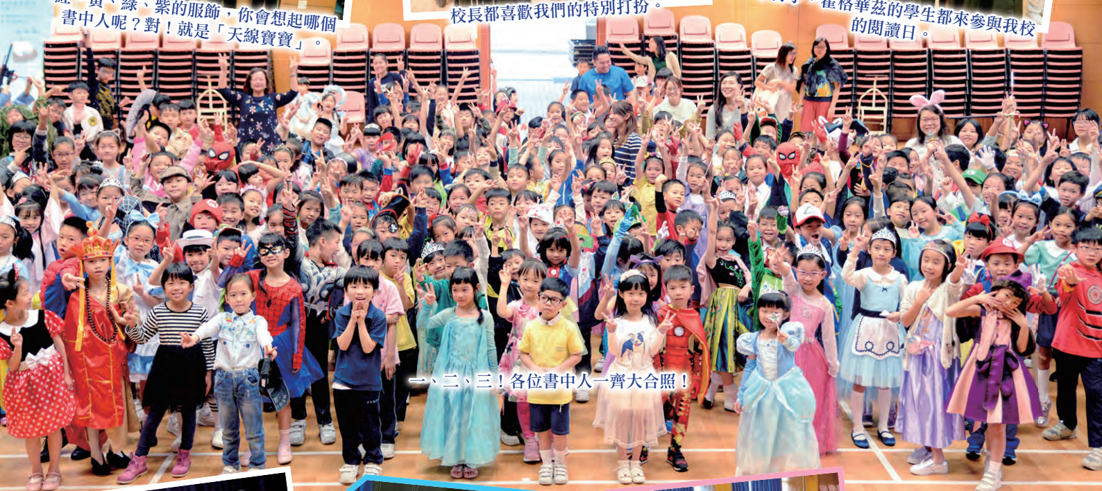
一、二、三！各位書中人一齊大合照！