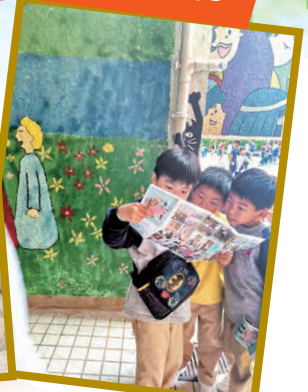
小息時，同學們帶着小冊子尋找校園的新景點。