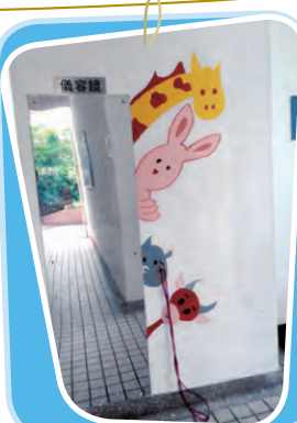
誰偷看你的儀容？ 創作者：6A 陳賢芝