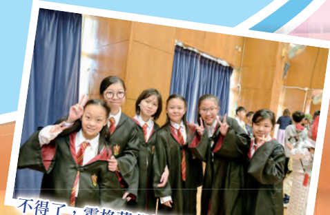
不得了，霍格華茲的學生都來參與我們的閱讀日。