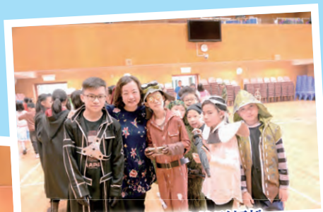
校長都喜歡我們的特別打扮。