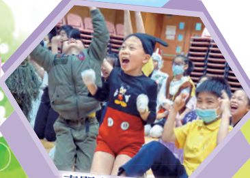
真開心！我們那一組又得分了。