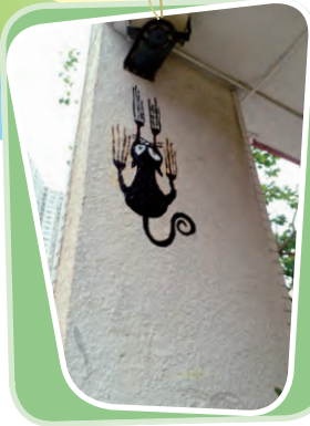
牆上的貓兒 創作者：6B 何頌賢