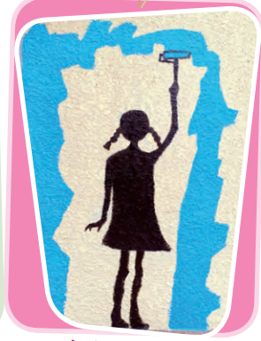
一起和女孩去鬆油 創作者：6C 馬彭盈