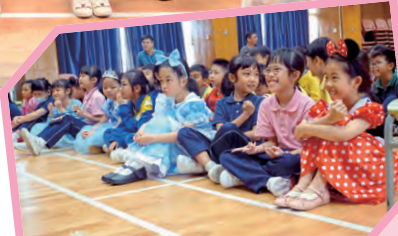
台下觀眾各有趣怪的表情。