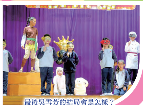
最後吳雪芳的結局會是怎樣？