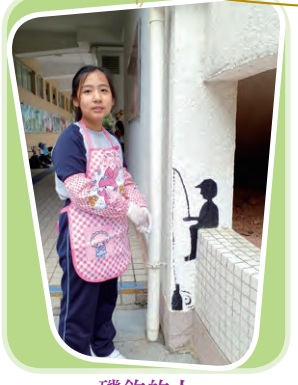
磯釣的人 創作者：6A 林曉婷