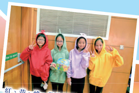
紅、黃、綠、紫的服飾，你會想起哪個書中人呢？對！就是「天線寶寶」。

三月天，春花開滿天！一陣陣花香氣，還有一陣陣書卷味，伴隨着我們度過這美好的一天——全校閱讀日。當天學生們可以扮演成自己喜愛的書中人物，或穿着特別的服飾，或配戴各種有趣的道具，享受着不同類型的閱讀活動，真令人興奮呢！最受歡迎的閱讀活動，當然是書展，學生們可以慢慢看新推出的圖書，並購買心愛的圖書，還可安靜地閱讀圖書，細心領略圖書帶來的趣味。最令人期待的是小一至小四學生可以「活現書中人」，他們除了精心打扮成書中人物外，還要把角色的性情、動作、語言演繹出來，各出奇謀爭奪「最佳表現」、「最佳演繹」等獎項。使人血脈沸騰的活動必定是「閱讀擂台問答比賽」，各位參與其中的班代表努力作答，希望為自己的組別爭取佳績。當天，粉嶺禮賢會中學的師生為小五至小六學生帶來一場特別的劇場，讓學生們多認識「Q版特工」，師生同樣歡喜萬分。在一片歡樂聲中，閱讀日圓滿結束了。期待明年更精彩的閱讀日。