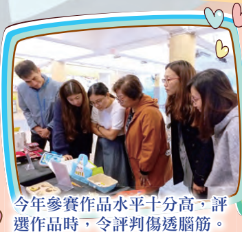
今年參賽作品水平十分高，評選作品時，令評判傷透腦筋。