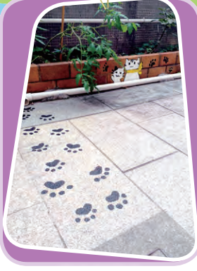
齊來行貓步 創作者：6C 麥麗琪