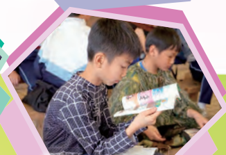
買完書，當然要立刻閱讀。