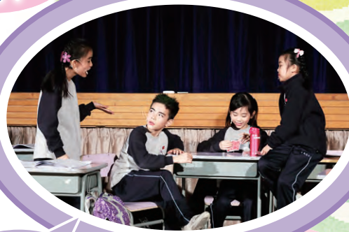
同學們對她 撒謊的行為 多麼不屑。