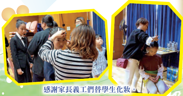
感謝家長義工們替學生化妝。