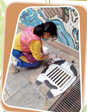
牛牛在坑渠上 創作者：6C 陳曉瑩