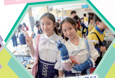
我們一起相約在書展購物，好滿足。